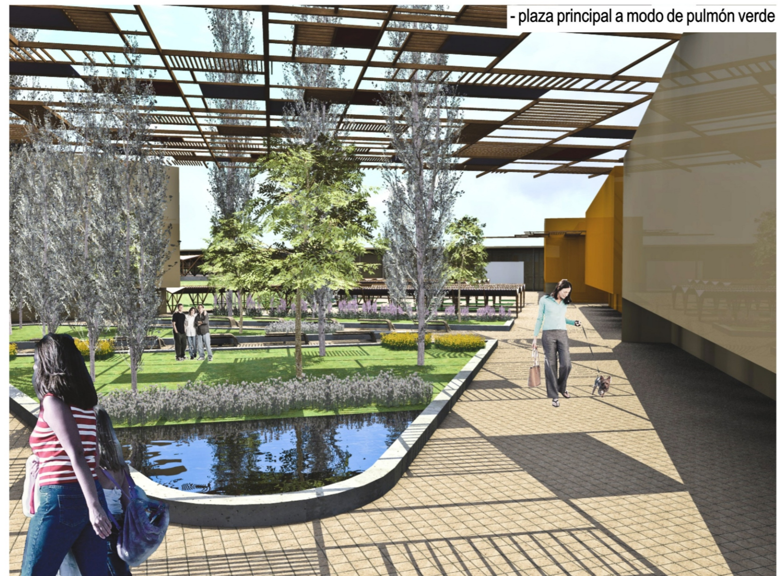
- plaza principal a modo de pulmón verde

- Estacionamiento de camiones y venta La venta directa desde los camiones es una actividad muy fuerte en el mercado. Sin embargo esta actividad, hoy en día aumenta los niveles de desorden del lugar, para lo cual se decide mantenerla pero optimizando su funcionamiento y alejándola del centro del "Mercado campesino" estableciendo una manzana exclusiva, en un terreno antes no aprovechado para el comercio. Se proyectan cubiertas que permiten el establecimiento de puestos improvisados en la descarga de camiones.