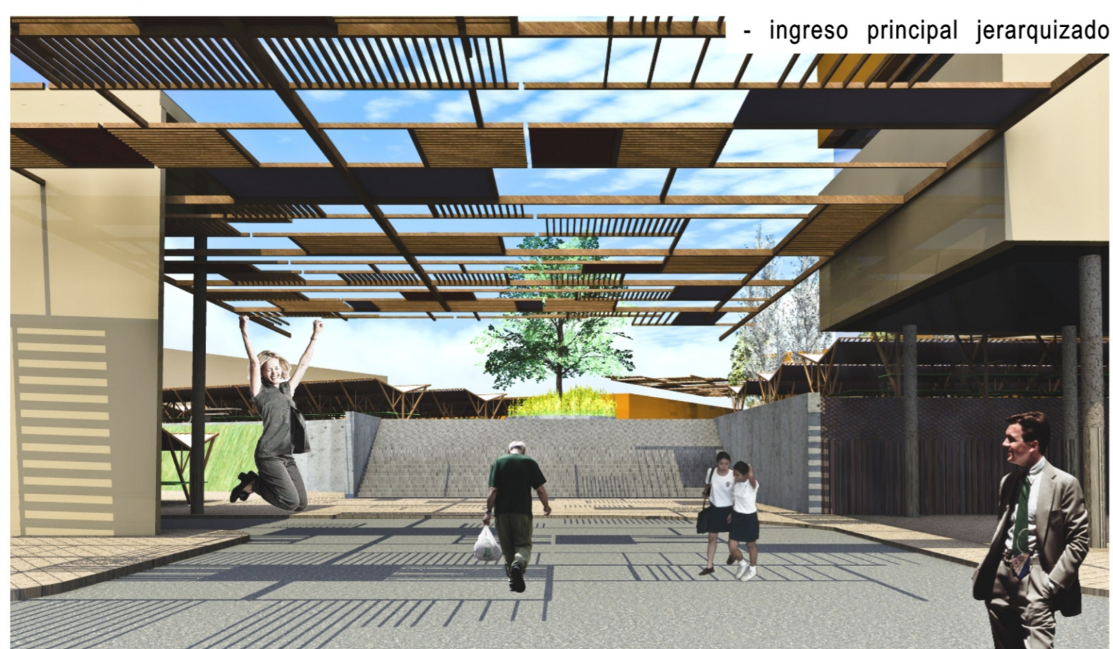
- ingreso principal jerarquizado