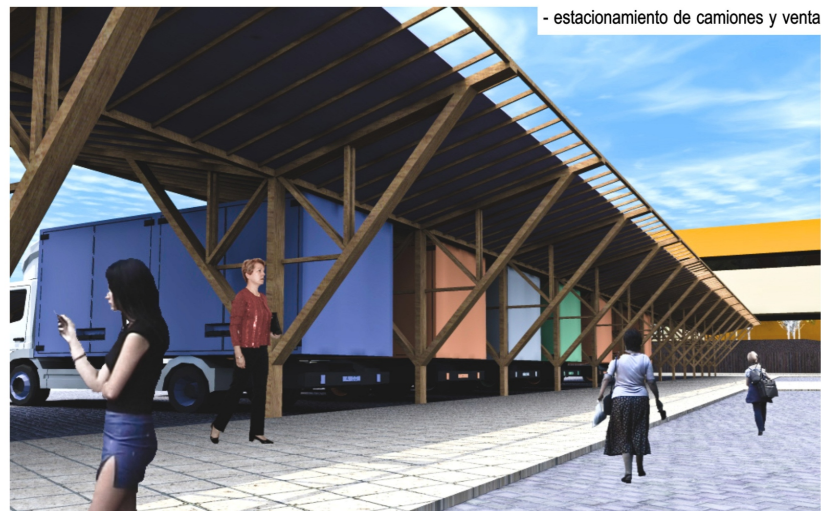
- estacionamiento de camiones y venta