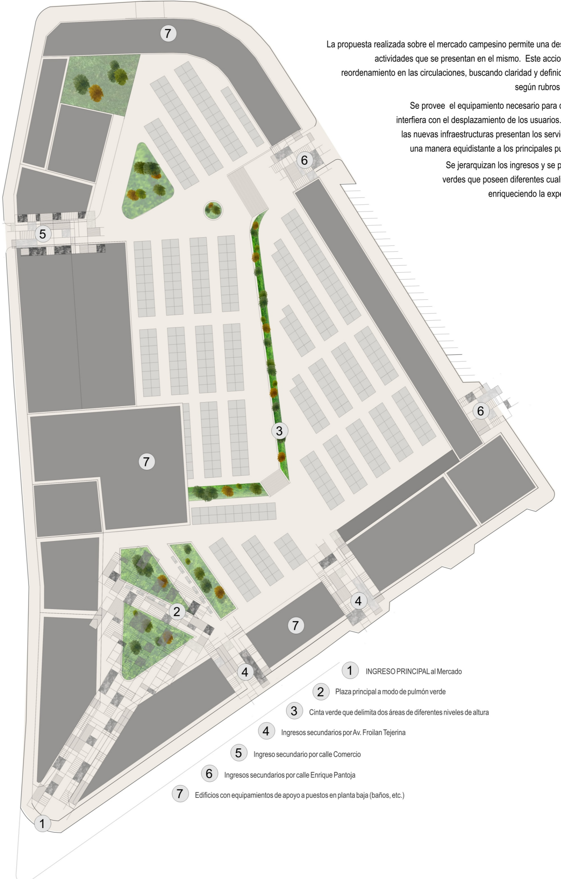
- planta de techos MERCADO CAMPESINO

La propuesta realizada sobre el mercado campesino permite una descongestión de las actividades que se presentan en el mismo. Este accionar consiste en un reordenamiento en las circulaciones, buscando claridad y definición en el recorrido según rubros o ejes principales. Se provee el equipamiento necesario para que el comercio no interfiera con el desplazamiento de los usuarios. Al mismo tiempo, las nuevas infraestructuras presentan los servicios necesarios de una manera equidistante a los principales puntos del mercado. Se jerarquizan los ingresos y se proyectan espacios verdes que poseen diferentes cualidades espaciales, enriqueciendo la experiencia comercial.