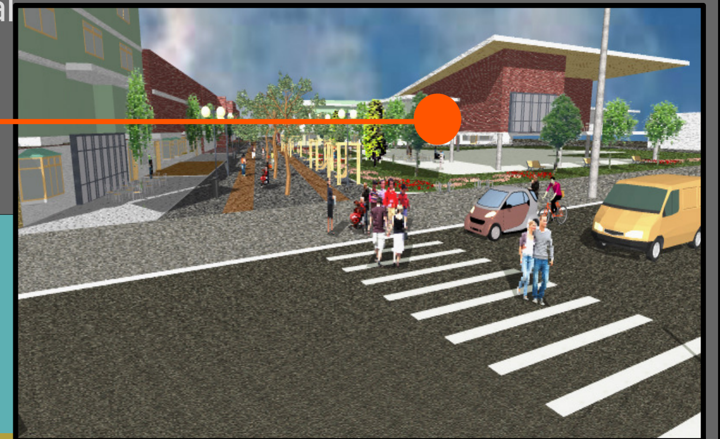
EQUIPAMIENTO Y ESPACIO CIRCUNDANTE