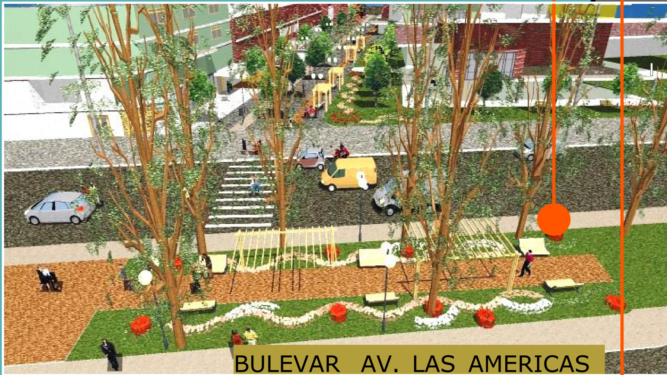
BULEVAR AV. LAS AMERICAS

REORGANIZAR el TRÁFICO vehicular y peatonal