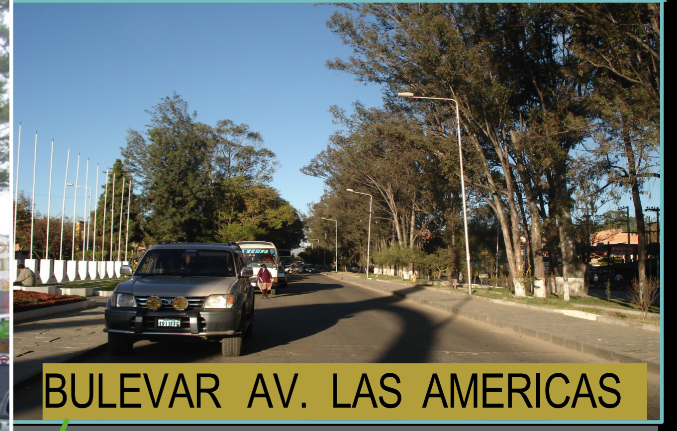
BULEVAR AV. LAS AMERICAS