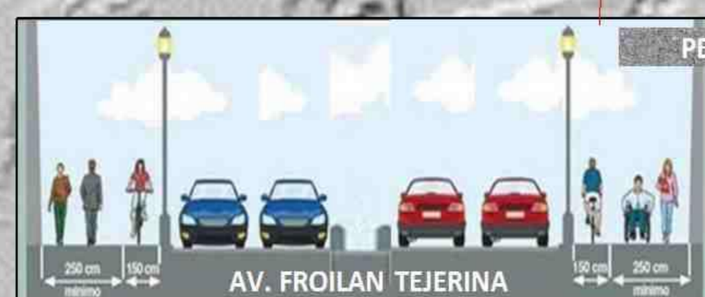
AV. FROILAN TEJERINA