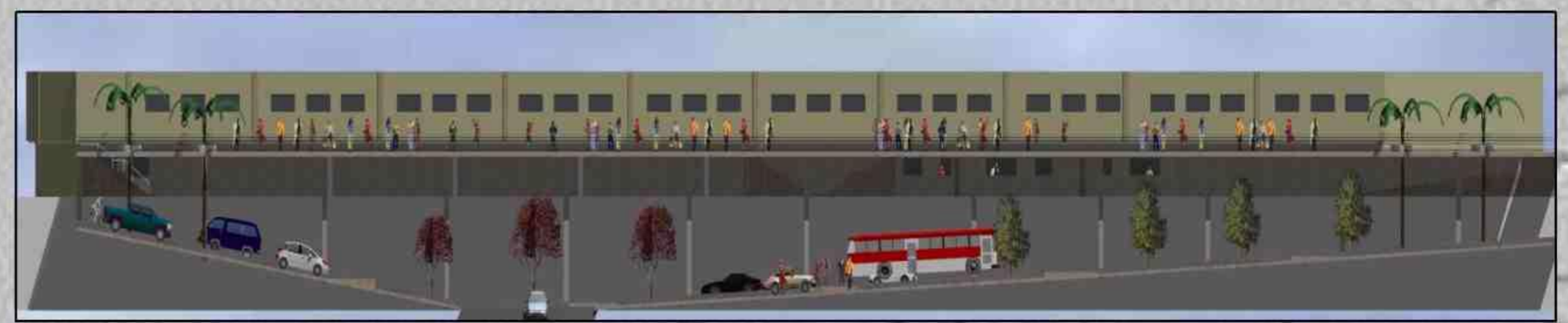
CORTE TRANSVERSAL DE LA PLATAFORMA